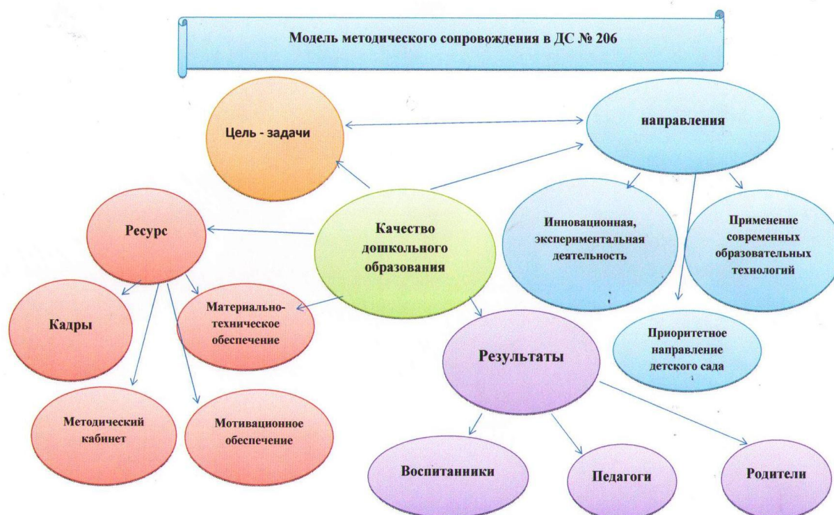
Рисунок 3. Модель методического сопровождения в детском саду № 206

Работа с кадрами была направлена на повышение профессионализма, творческого потенциала педагогической культуры педагогов, оказание адресной методической помощи воспитателям. С этой целью используется модель методического сопровождения, которая позволяет обеспечивать рост педагогического мастерства и развитие творческого потенциала каждого педагога, осуществлять на высоком уровне педагогический процесс с учетом потребностей обучающихся и запросов родительской общественности. (Рисунок 3). Заместителем заведующего по воспитательной и методической работе составлен план прохождения аттестации и повышения квалификации педагогов через обучение на курсах.